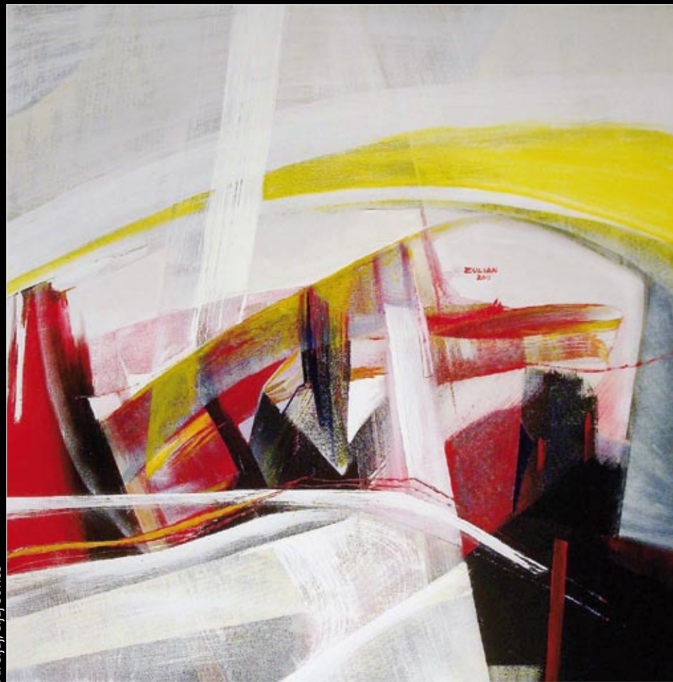
Ali sijaj, sijaj sonce